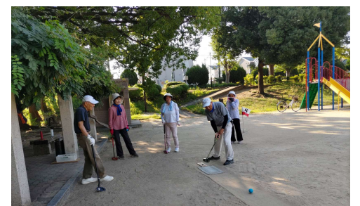
大清水公園では早朝のグランドゴルフの練習前に、グランド内の整地・ごみ拾い、草取りを行います。遊具のまわりや草むらに犬のふんが落ちており、片付けるのに大変困っております