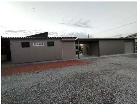
現在の防災倉庫の東側に第2防災倉庫を増築

現在の防災倉庫が手狭となり、第2防災倉庫の検討を約1年かけて検討してまいりました。7月上旬より着工した第2防災倉庫は8月7日立会検査を行い、完成しました。屋根は南面傾斜とし、将来太陽光パネルが乗せられる強度な仕様としました。また大型物品の搬出入を可能とするため、前面と側面にシャッターを取り付けました。