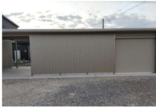
側面は通常出入り口の外、シャッター付き出入り口を設け、雨天でも搬出可能なように軒屋根を取付け