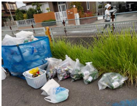
ビン・缶を混ぜてレジ袋に入れて廃棄

昨年の12月6日(水)ビン・缶の日に役員が分別ごみ収集拠点を巡回した時の様子です。前日か当日早朝に捨てられたものと思われます。見るに見かねて立ち当番の人が、これらを分別して頂いているのが現状です。(えっ！、立ち当番だけじゃないの???)