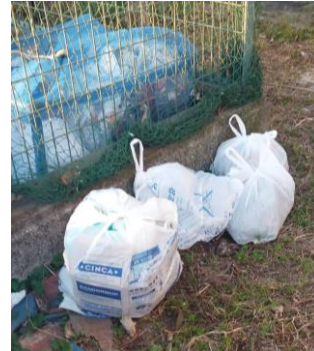
プラごみをネットに入れず、脇に廃棄