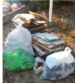
収集日でないペットボトルやダンボールを廃棄