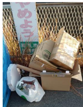
収集日でないペットボトルやダンボールが廃棄