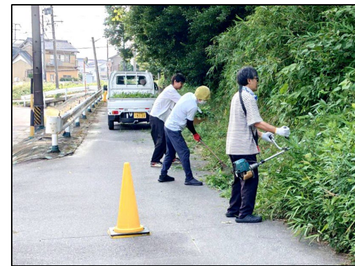
境内下の北側 (たかびれ公園下)