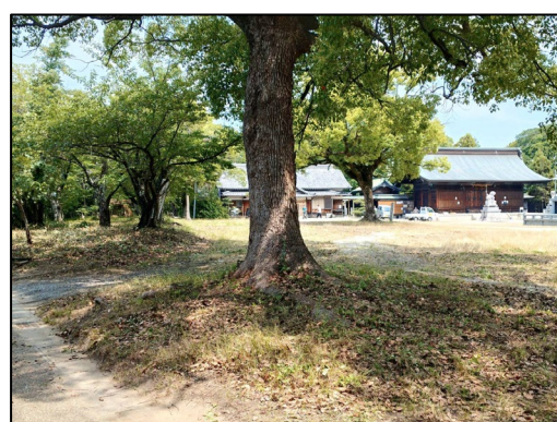
参加いただいた方、お疲れさまでした