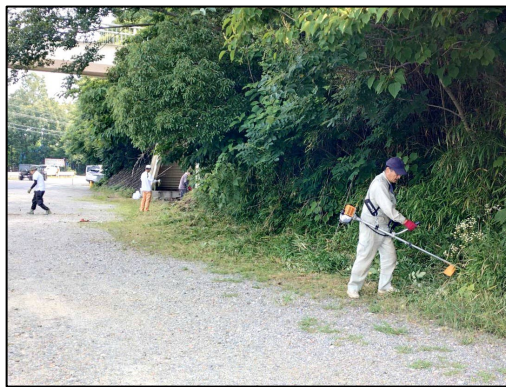
境内下の西側 (県道50号線寄り)