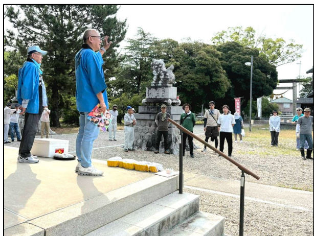
氏子総代の挨拶と作業上の注意点お願い