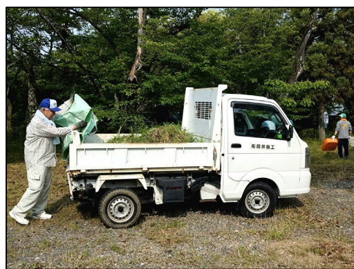
刈り取りの草は軽トラで運搬