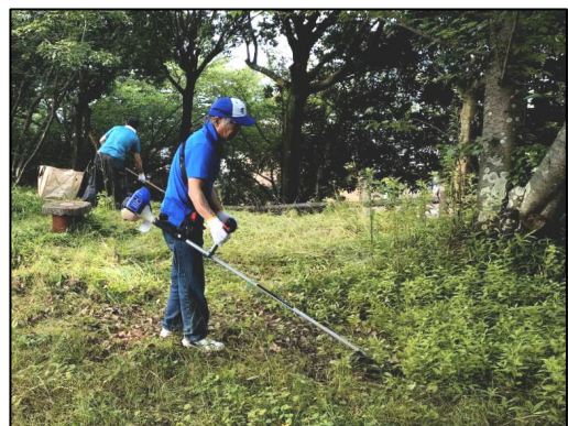
境内の南側 (お祭りの馬待機場所あたり)

毎年同じ場所から生える多年生雑草等は、除去が厄介なので壮年男性にお願いして草刈り機の出番でした!