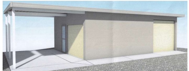
第2防災倉庫(外観イメージ)