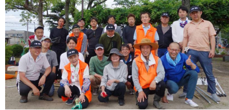
町内会役員・事業部メンバー

大坪公園周りは側溝に落葉と泥で雨水が流れず、不衛生の状態でした。大坪公園周りの側溝の泥上げ、公園内の草刈り、土手の草刈りで汗を流しました。