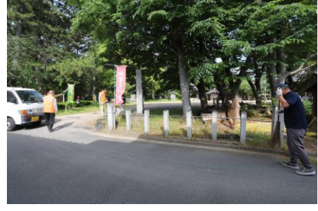
ごみ回収拠点3 (八幡公園)