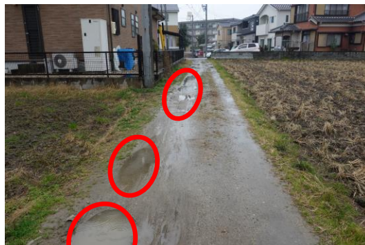
補修前 (赤枠が窪み)