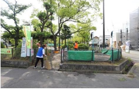
ごみ回収拠点1 (大坪公園)

5月26日(日)早朝8時より市民一斉清掃に参加・ご協力頂き、誠にありがとうございました。各家庭周りの路上のごみ拾い、側溝の泥上げ、道路脇や公園の草刈りなど実施して頂きました。 当日市役所の方のご協力により2トン車によるごみの回収と、翌日は雨の中2トン車1台・軽トラ2台分相当の側溝の泥を回収して頂きました。お陰様で、八幡町・新田町は綺麗になりました。