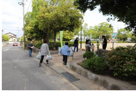
ごみ回収拠点2 (大清水公園)