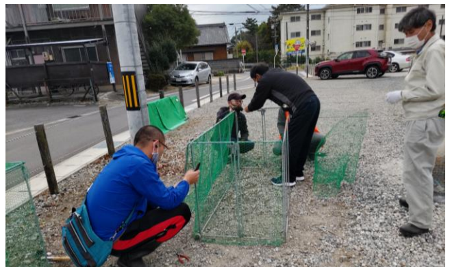
網が破れたため、燃えるごみケースを金網に取替え (きずな会館駐車場)