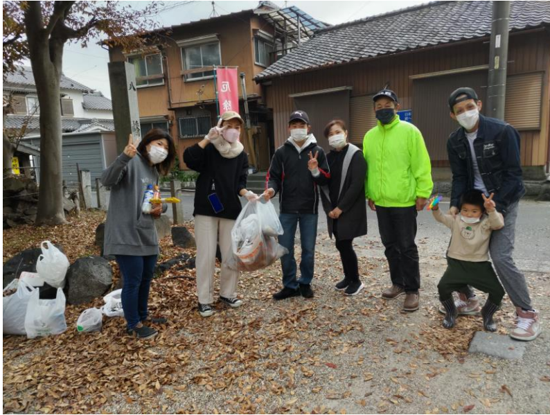
道路のごみ拾いで、家族そろっての参加です(八幡公園)

市民行動の日「一斉清掃」(11月20日)が行われ、八幡公園・大清水公園・大坪公園を拠点として活動しました。心配された天候も曇り空で少し肌寒い日でしたが、少しでも街を綺麗にしたいとの思いで、道路上のごみ拾い、側溝の泥上げ、公園の草刈り等実施しました。作業は大変でしたが、綺麗になった街を見ると、すがすがしい気分となりました。