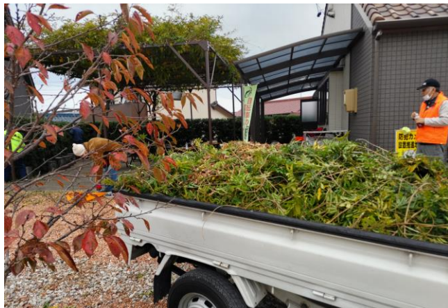
来年も綺麗な花が咲きますように!