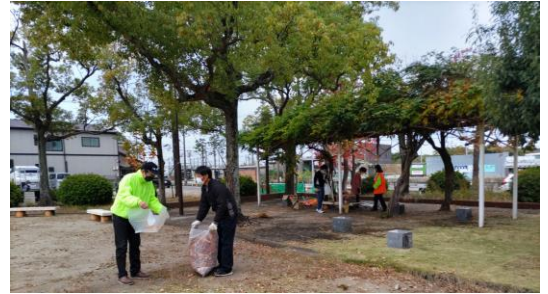
公園の草刈りと落ち葉拾い(大坪公園)