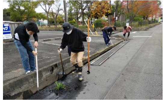
側溝の泥上げ(八幡町五丁目)