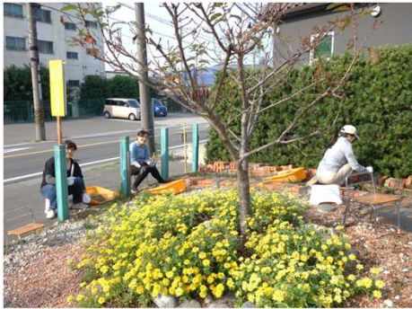
周辺の草取りで花々が引きたちます

町内会館(きずな)は、雨天時駐車場に水溜まりができるようになりました。皆さんが快適に利用できるように、また災害時には安心して車が止められるように、駐車場の整備を行いました。