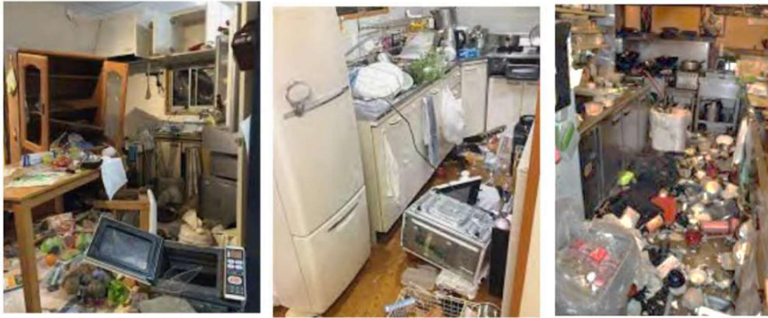
居間やキッチンで家具、電化製品、食材等で散乱した様子 (熊本震度7)

地震災害が発生すると家が倒れたり、家が残っていても自宅内は物で散乱することが予想されます。特にキッチンが使えないと食事が作れず、生活に困ってしまいます。こんな時に食の備えが大切になります。知恵と工夫で生き延びられる一例を紹介します。（吉浜まちづくり協議会での防災食講演会の発表例）