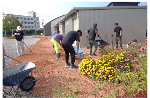
シヤモット2t車4杯による美観と草抑え