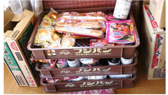
避難所で提供される非常食は、水気が無い、冷たい、量が多い・少ない、みんな同じもの、嫌いなもの等様々です。