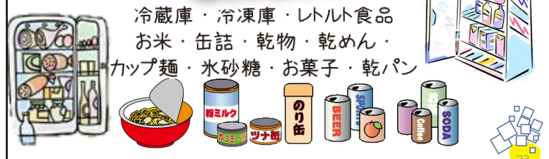
冷蔵庫の中にある食材は非常食