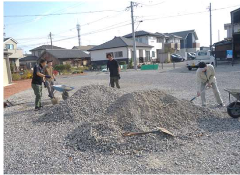
2t車4杯の砂利による凹凸の整備