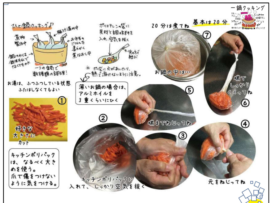
一つの鍋と色々な食材で、暖かく美味しい非常食が作れます