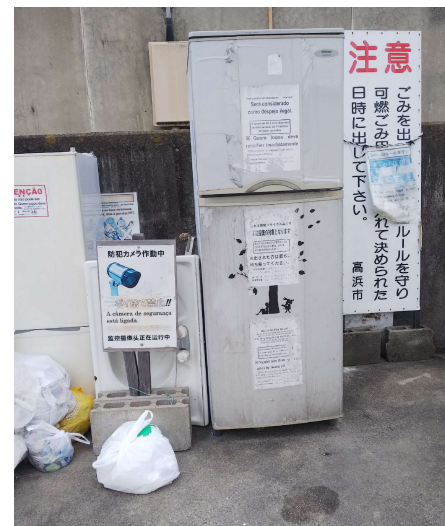
不法投棄された大型粗大ごみ (三丁目 県営吉浜住宅)